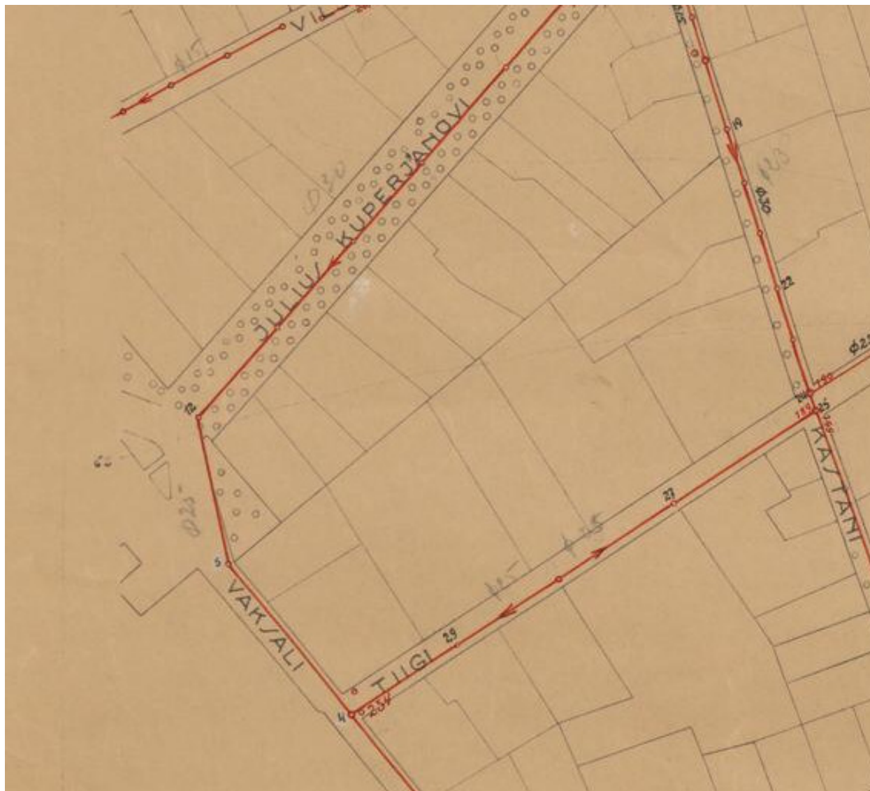
Joonis 6. Väljavõte 1936.a. (hinnanguline) plaanist. 19