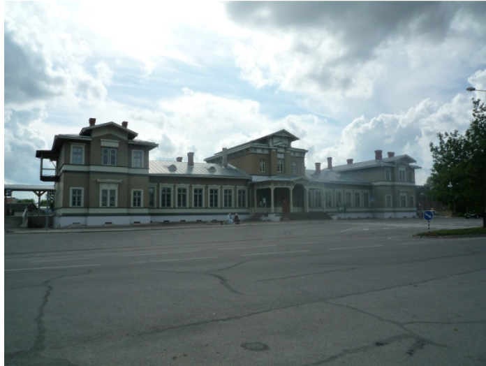
Foto 2. Tartu raudteejaama hoone Vaksali 6, 1876-1878.a., reg nr 7013. 23.05.2013.a.