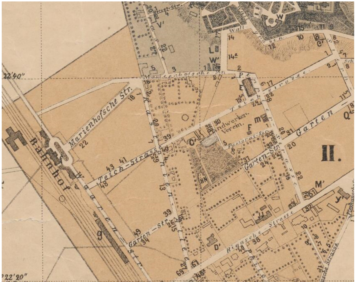
Joonis 2. Väljavõte 1892.a. plaanist. 15