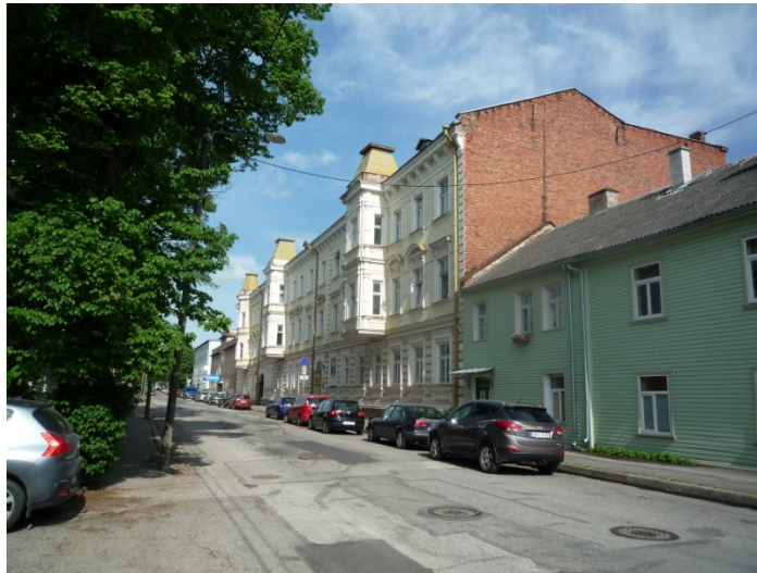
Foto 5. Elamu Tartus Tiigi 78, 1891.a., reg nr 7023. 23.05.2013.a.

Majas asus era-tütarlastegümnaasium. Alates 1917 aastast oli krundil malmivalutehas, 1934 ostis kinnistu Kauba Pank. Tänapäeval on hoone Tartu Ülikooli käsutuses 9 .