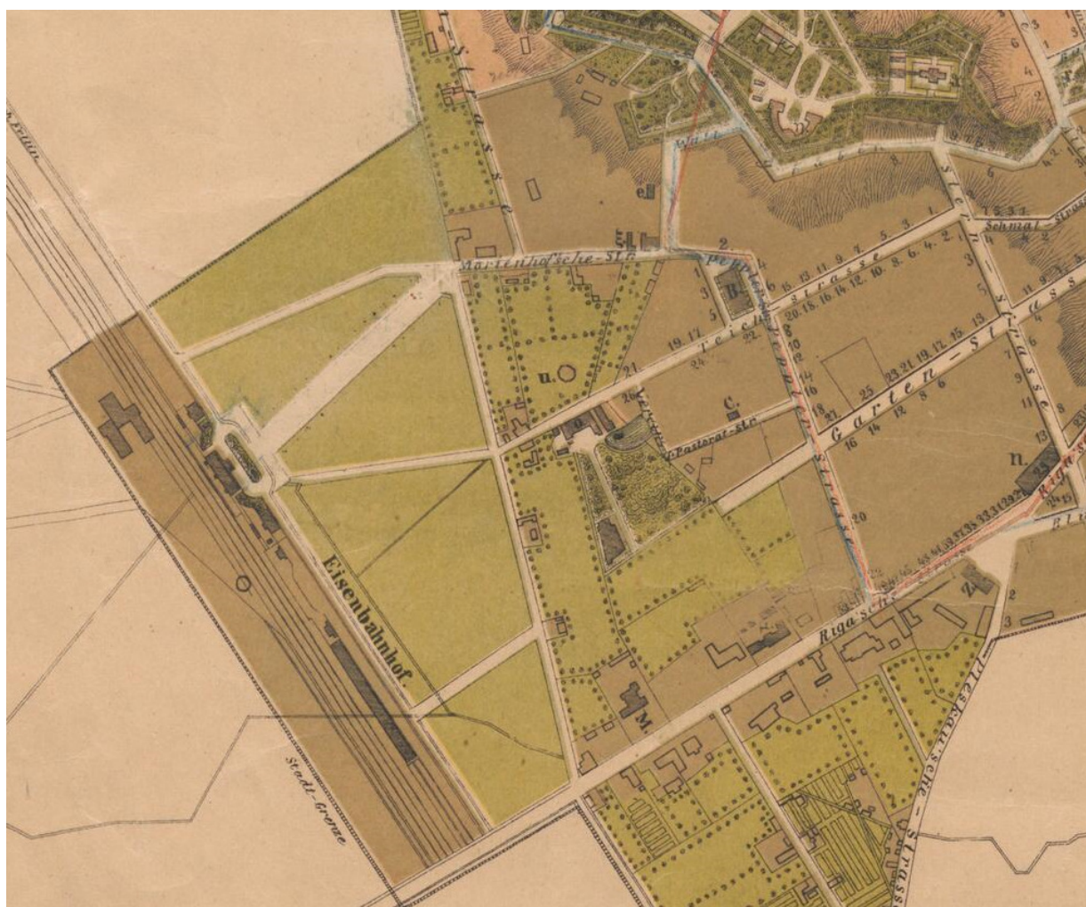
Joonis 1. Väljavõte 1877.a. kaardist. 14