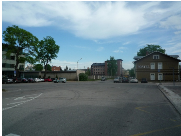
Foto 6. Vaade raudteejaama eest planeeringuala suunas. 23.05.2013.a.