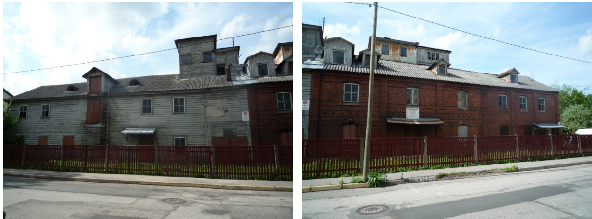
Foto 5. Tööstushoone Tartus Tiigi 61a, 1886.a., reg nr 7024. 23.05.2013.a.