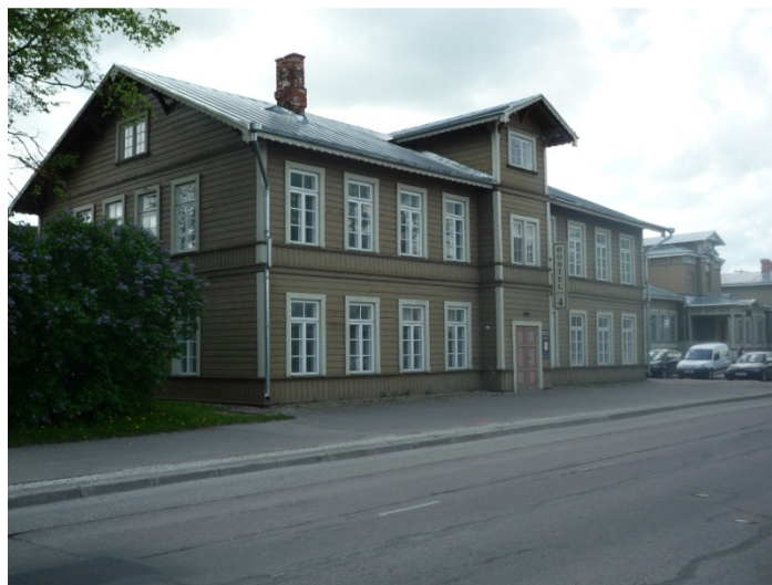
Foto 3. Raudteetöölise elamu Tartus Vaksali 4, 19.saj., reg nr 7014. 23.05.2013.a.

Muinsuskaitseameti kultuurimälestiste riikliku registri info kohaselt on 19. sajandi lõpust pärit historitsistlik hoone iseloomulik näide raudteetööliselamust, moodustades koos Tartu vaksalihoone ja Vaksali 8 tööliselamuga tervikliku kompleksi. Kogu kompleks valmis 1880. aastal.