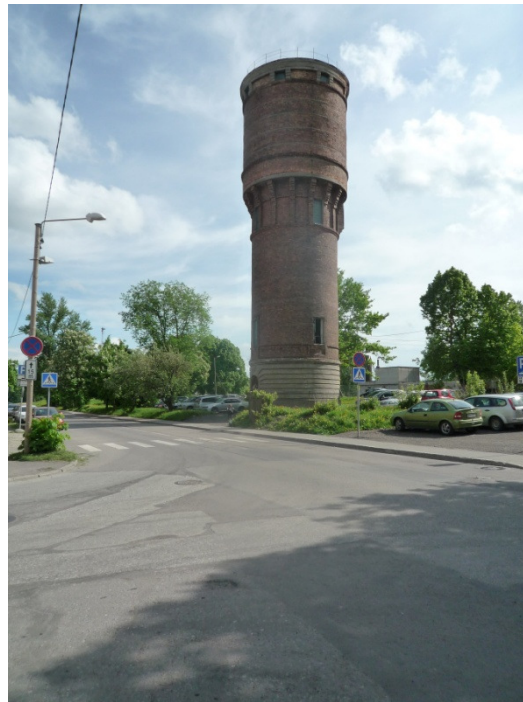
Foto 4. Tartu raudteejaama veetorn, 1890.a., reg nr 7016. 23.05.2013.a.

telistest laotud ümartorniga. Torni ülaosas on konsoolidele toetuv laiem osa. Hoone detailideks on simsid ja kaarsillusega uks. Torni peal metallrinnatis 6 .