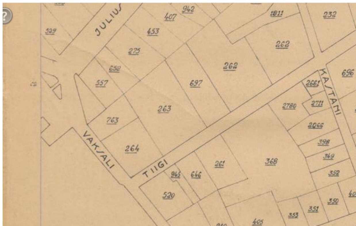
Joonis 7. Väljavõte 1938.a. plaanist. 20