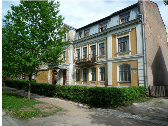
Foto 1. Elamu Tartus J.Kuperjanovi 54, 1902.a., reg nr 7009. 23.05.2013.a.