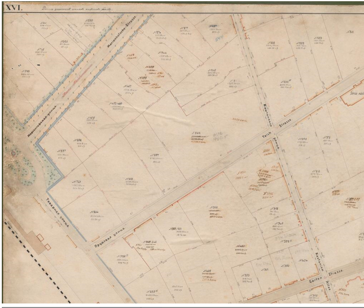
Joonis 3. Väljavõte 1914.a. plaanist. 16