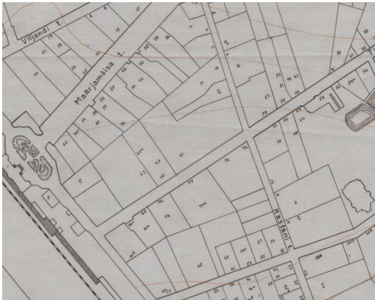
Joonis 4. Väljavõte 1920.a. (hinnanguline) plaanist. 17